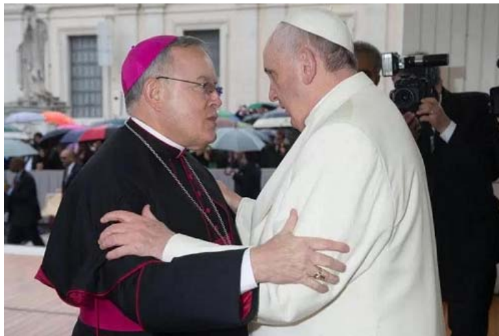
Le pape François et l'archevêque de Philadelphie Charles J. Chaput à Rome le 26 mars 2014