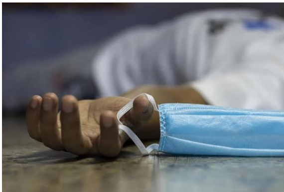
Les suicides de désespérés sont de plus en plus nombreux

Le candidat à la direction du Parti conservateur du Canada (PCC), Derek Sloan, a remis en question la fiabilité des décisions gouvernementales changeantes sur le port du masque.