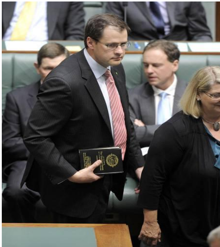
He even took the Koran into Parliament.