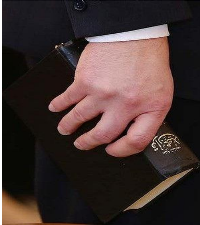
Ed Husic, with the copy of the Koran with which he was sworn in as a parliamentary secretary in July 2013.