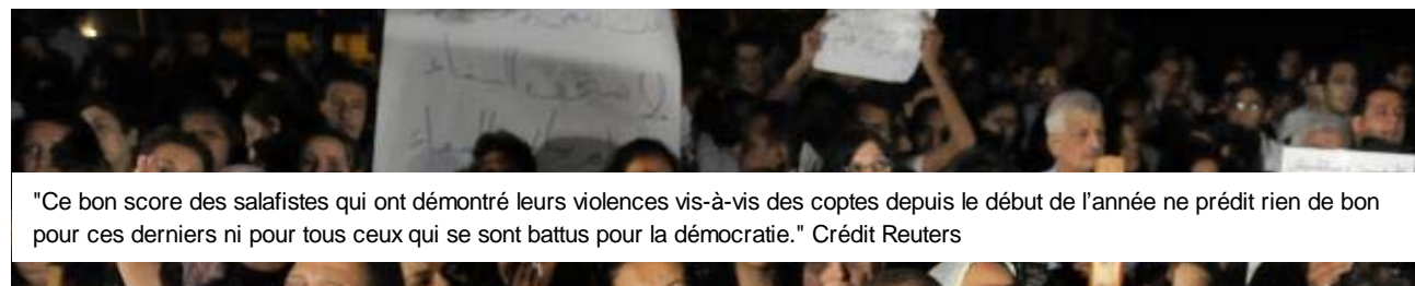
"Ce bon score des salafistes qui ont démontré leurs violences vis-à-vis des coptes depuis le début de l'année ne prédit rien de bon pour ces derniers ni pour tous ceux qui se sont battus pour la démocratie."