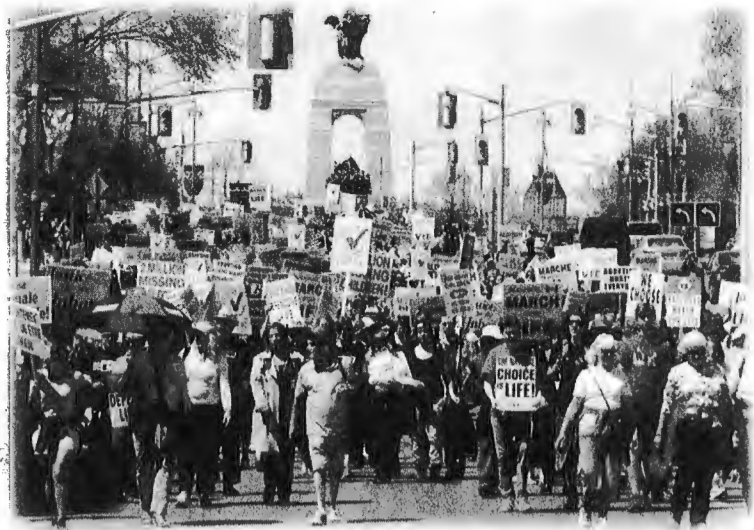
La Marche pour la Vie à partir de la Colline du Parlement à Ottawa Par Life Site News

Quarante-six ans jour pour jour après que le Canada ait légalisé le meurtre des enfants dans l'utérus, près de 25 000 personnes se sont rendues sur la colline du Parlement à Ottawa pour livrer le message suivant aux Canadiennes et Canadiens, et en particulier aux parlementaires : « J'appuie la Vie ! »